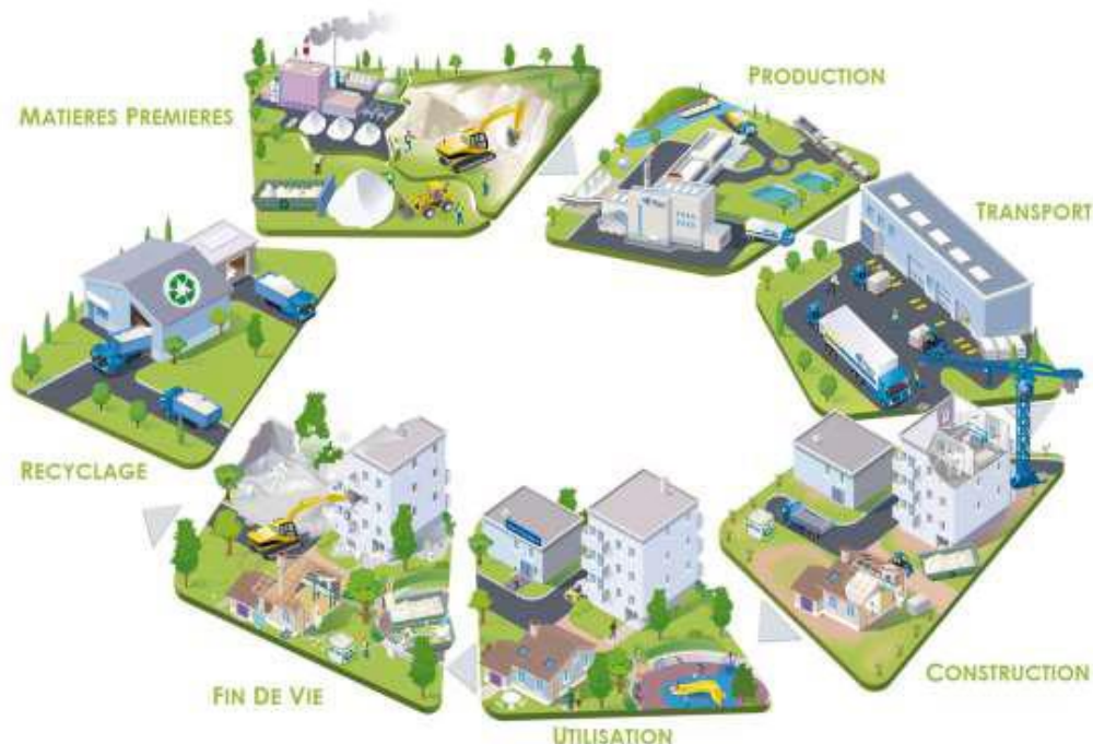
Schéma du cycle de vie